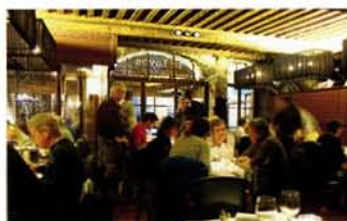
Qui sopra: cucina ricercata e ambiente easy al ristorante Le Layon . In alto: l'abside della cattedrale di St-Jean e, sullo sfondo, la basilica di Notre Dame de Fourvière. A destra: filati e stampi della Soierie St-Georges.